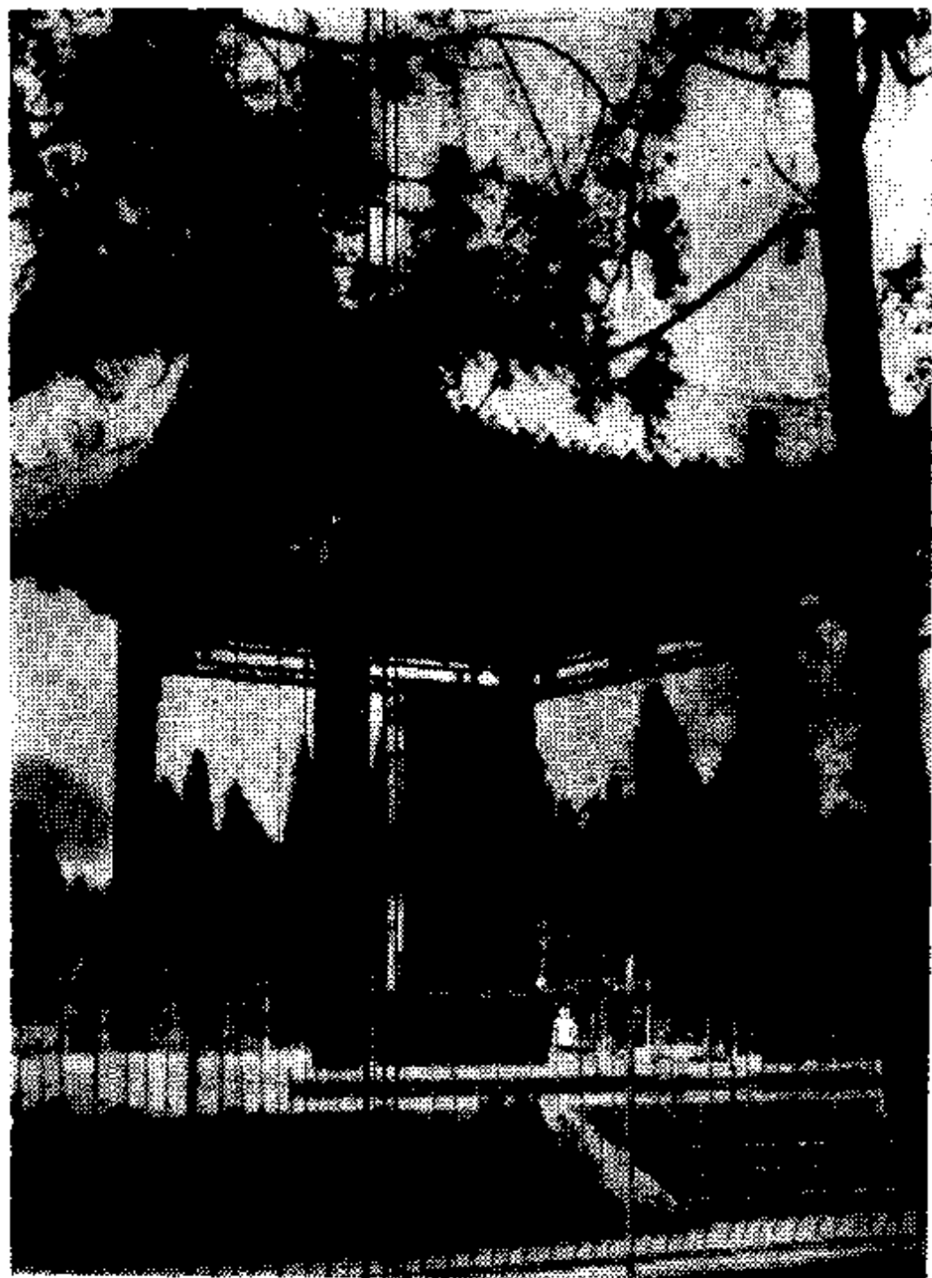
（张自忠将军神亭 殷黎明 摄影）