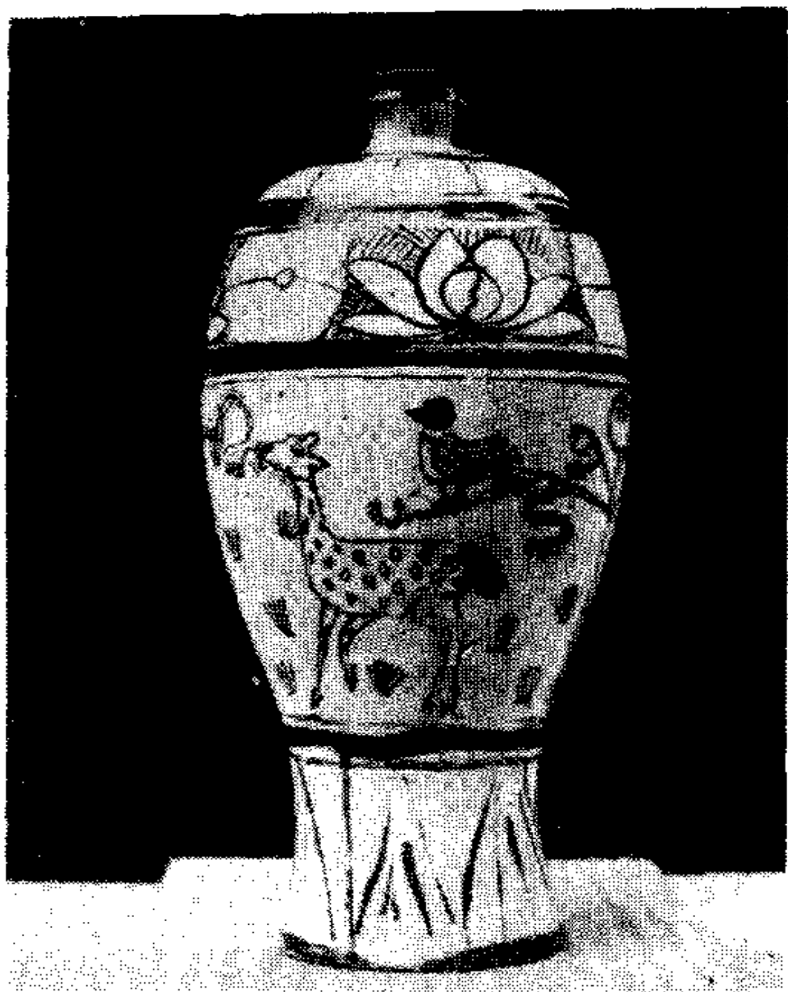
宋 代 梅 瓶