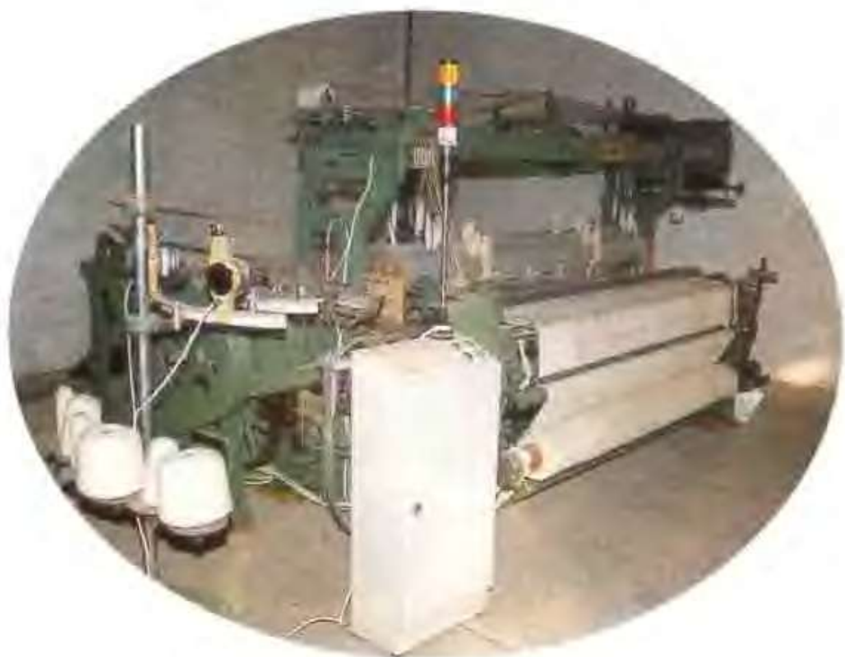
高唐县华兴提花织物厂的剑杆织机