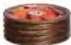
华风机械制造有限责任公司生产的离合器总承