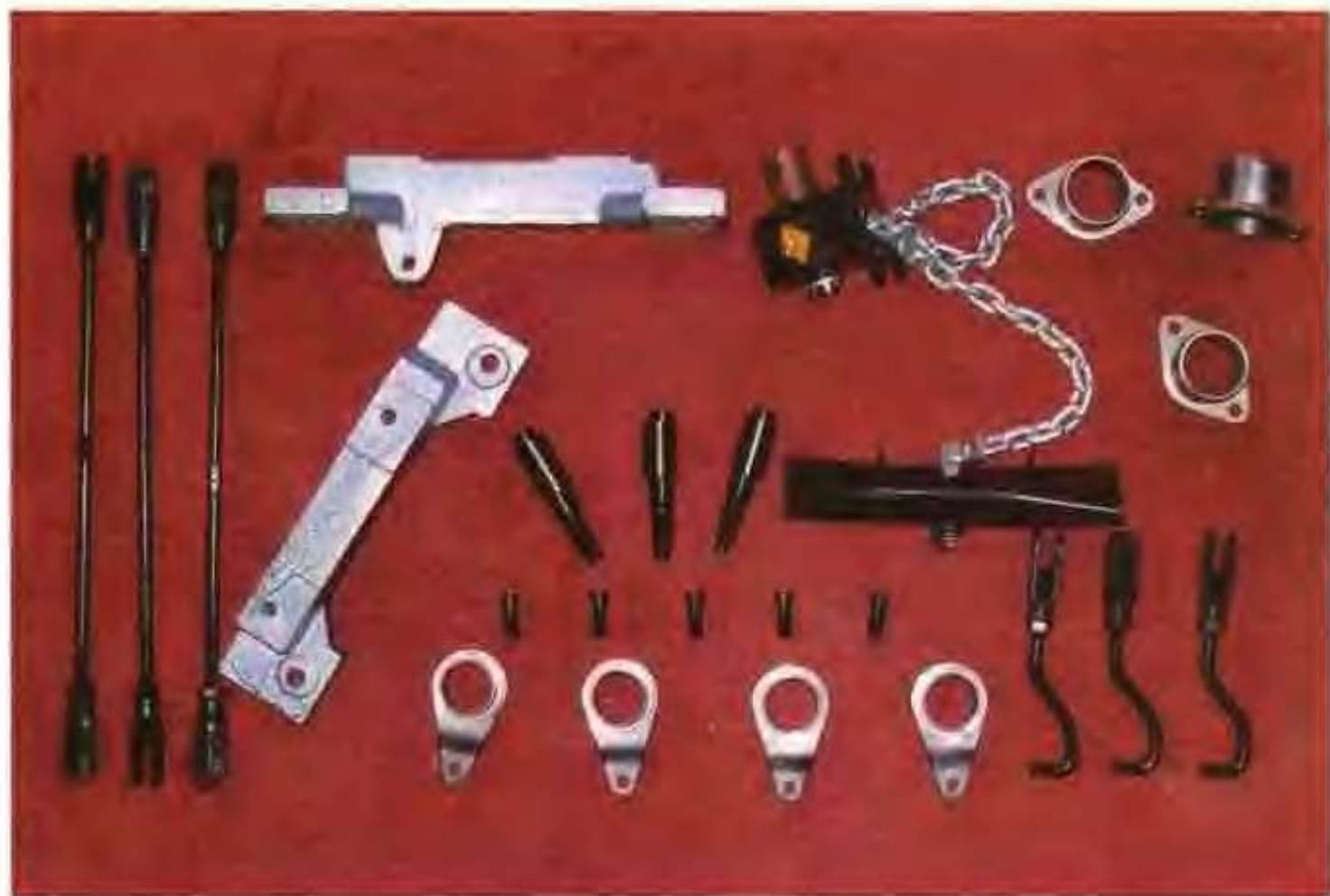
高唐县中兴机动车配件厂生产的各种农机配件