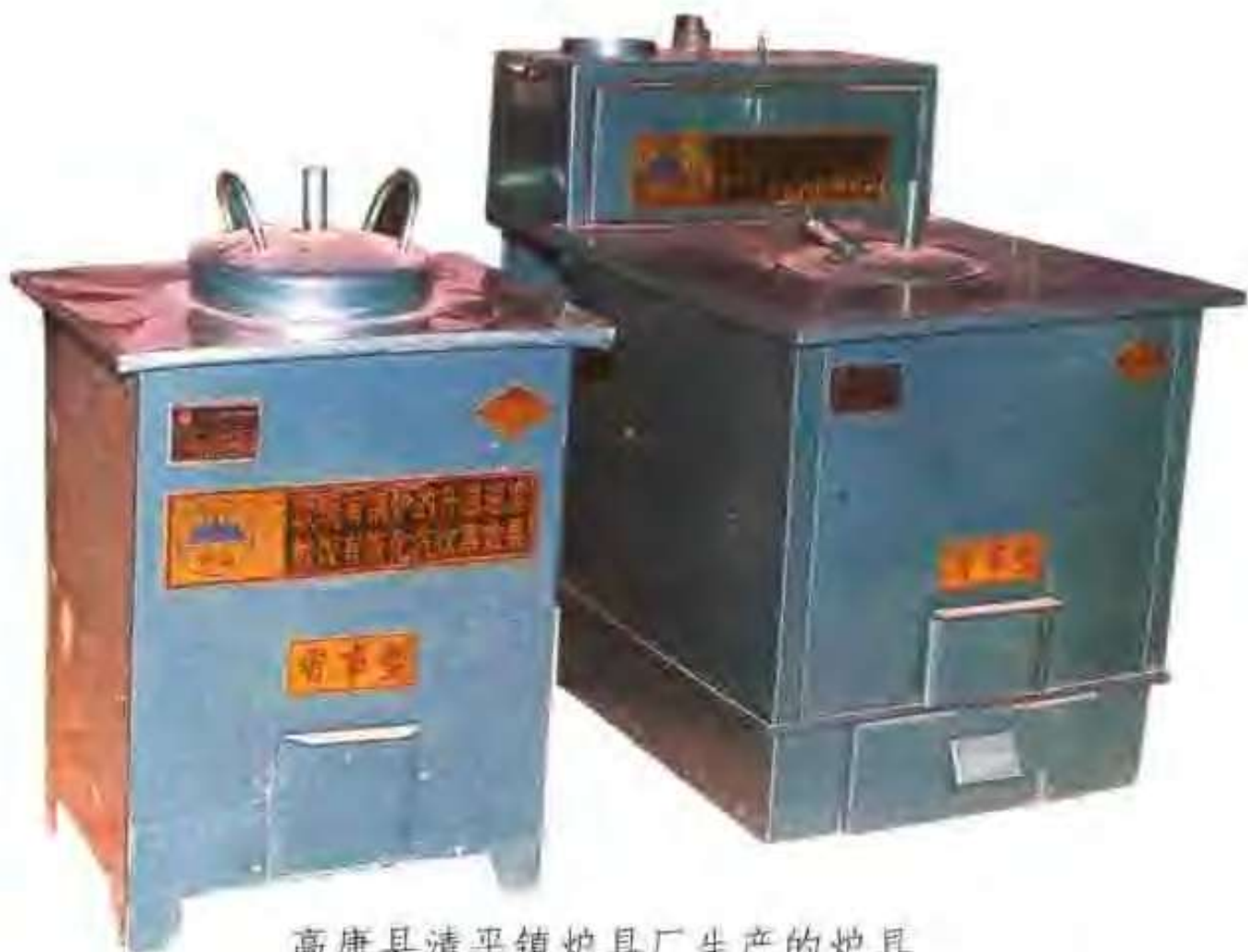
高唐县清平镇炉具厂生产的炉具