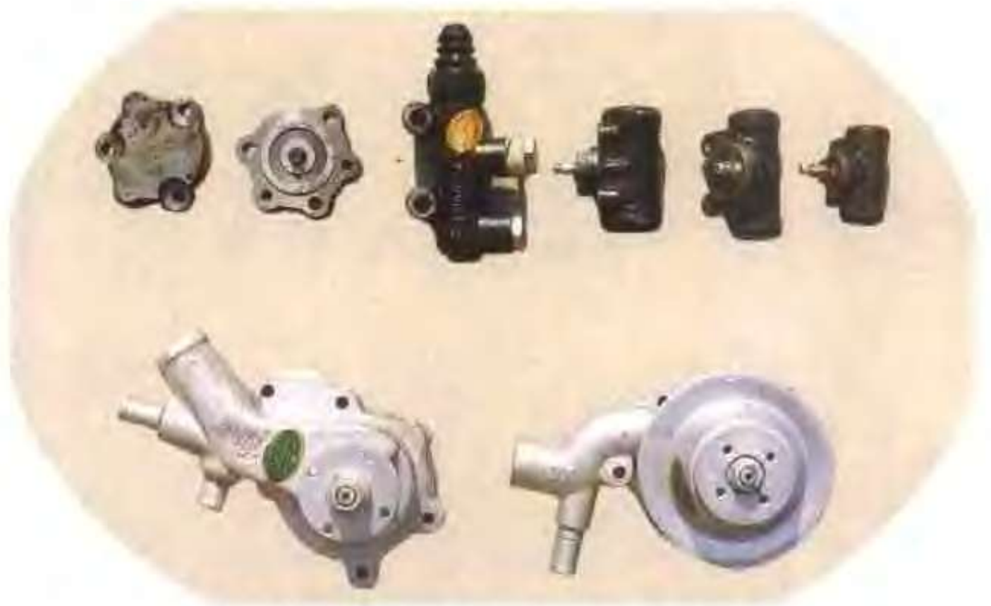
高唐县西北轴承工贸有限公司生产的冷却泵及其配件