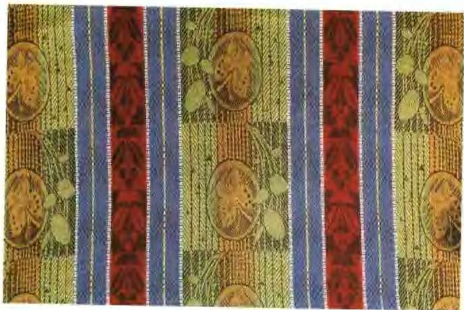
华兴提花织物厂生产的一次性地毯样品