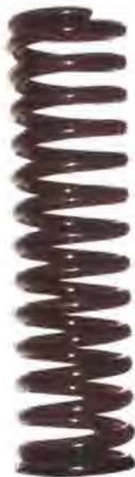
高唐县金洲金属材料制品有限责任公司生产的弹簧