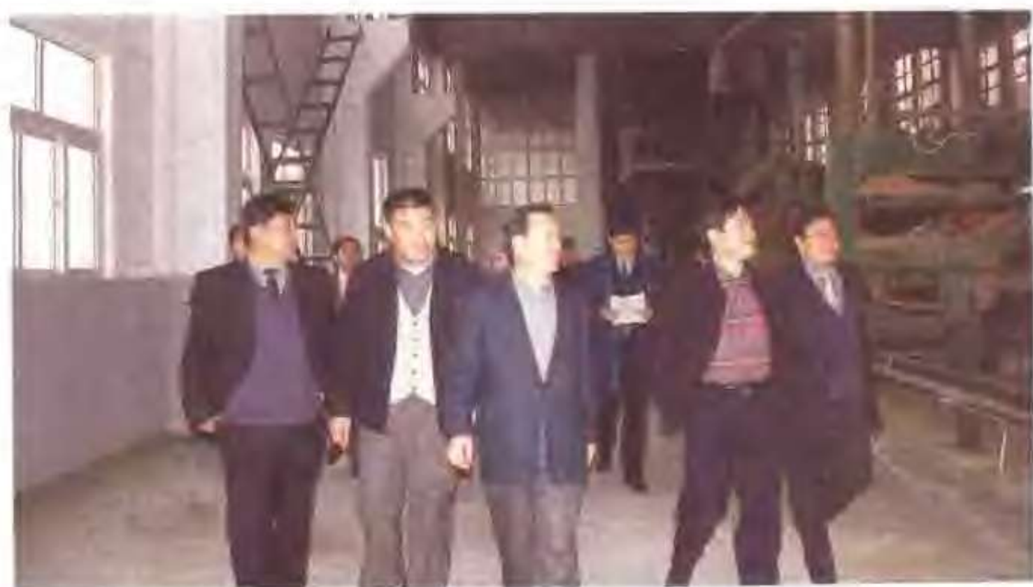
山东省委副书记陈建国（左三）、聊城市委副书记、市长张秋波（右二）在高唐县县长李伯平（右一）、高唐镇党委书记吕端义（左一）的陪同下视察金兴人造板有限公司。左二为该公司经理巩保庆。