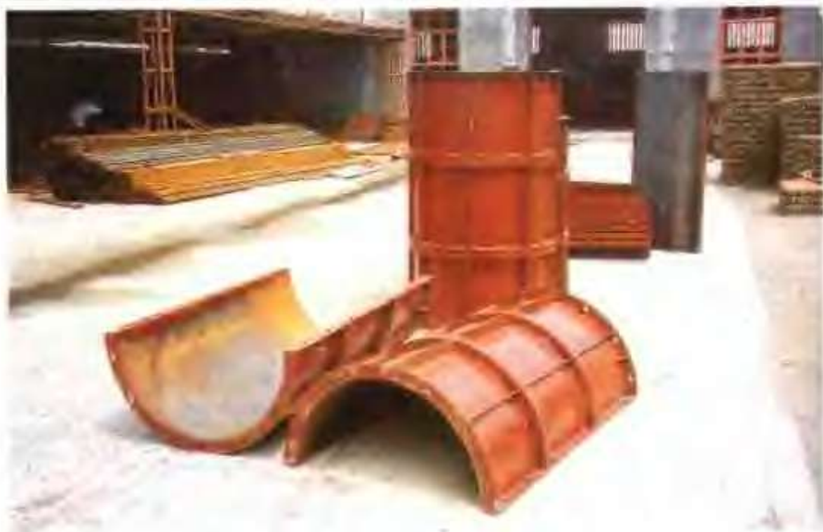
万达钢模板厂生产的异型模板