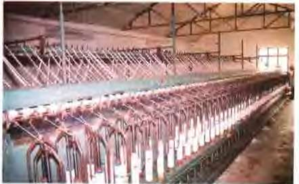
司细纱车间 油棉绒加工有限公司