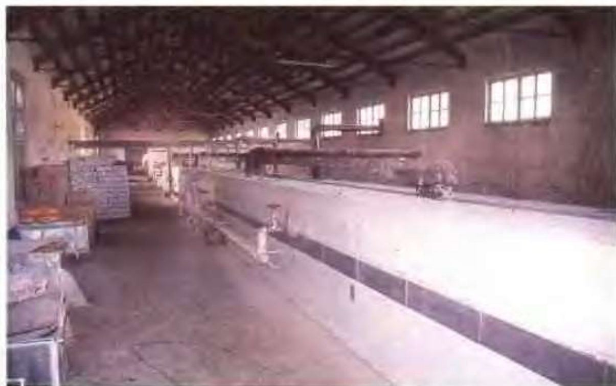
高唐县小宝贝食品厂的饼干生产线