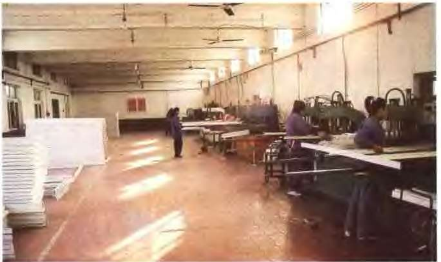
金兴塑钢门窗有限责任公司组装车间