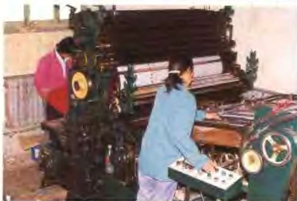
高唐华顺包装有限公司的 工人正在XPIAO单色全张平板 胶印机前操作