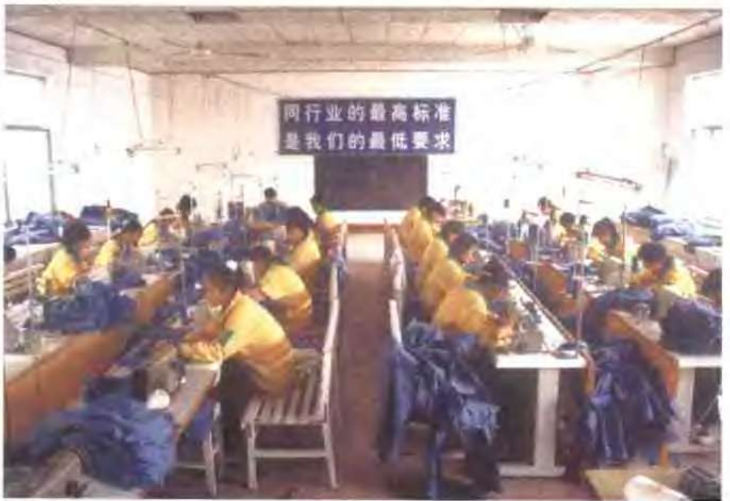
高唐县七星制衣有限公司制衣车间