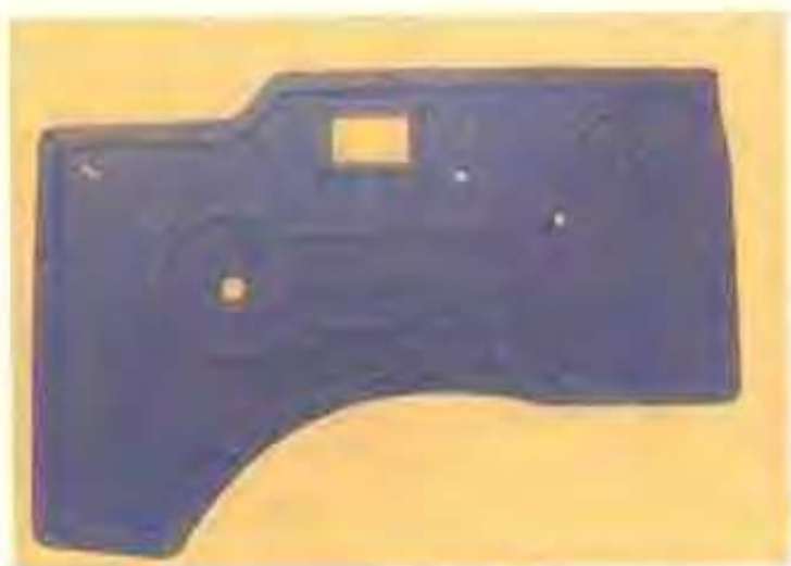
顺达橡塑制品厂生产的各种橡塑制品