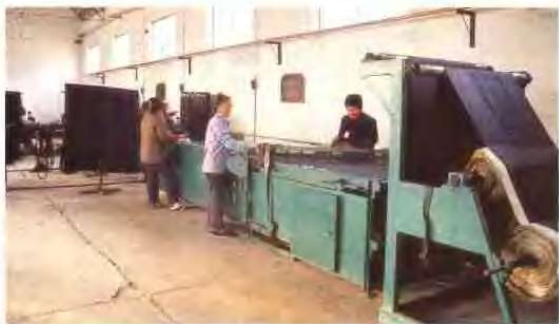
高唐县海龙橡胶有限公司