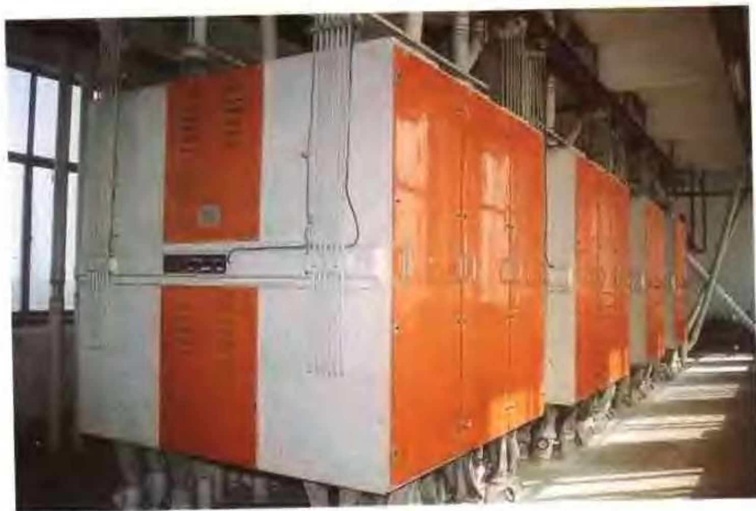
和兴面粉有限公司的方筛