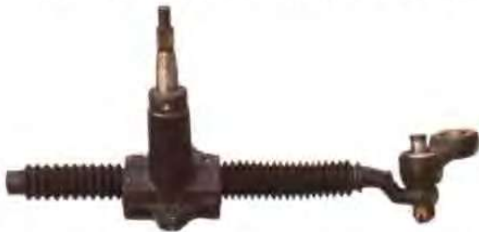
高唐县乘风工贸有限公司生产的农用车转向器