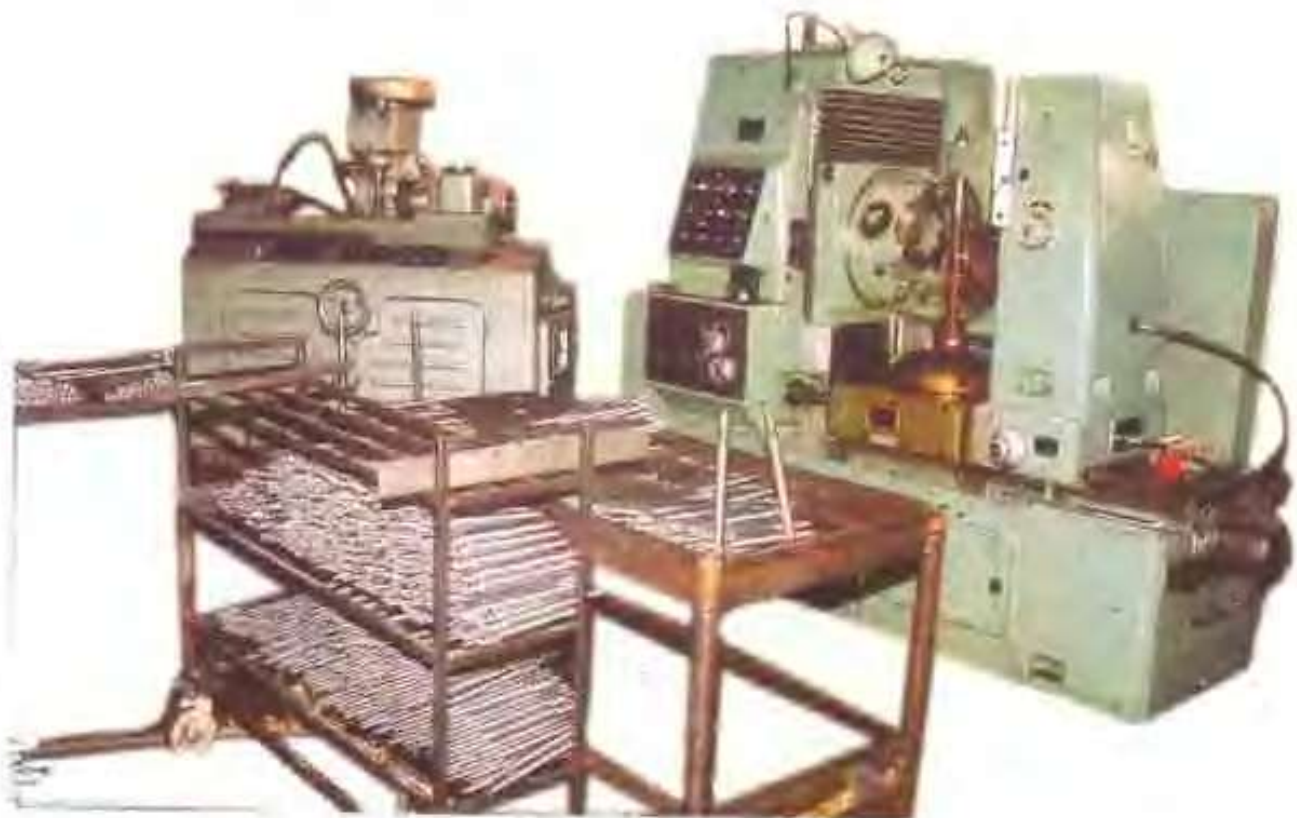
乘风工贸有限公司自动滚齿机