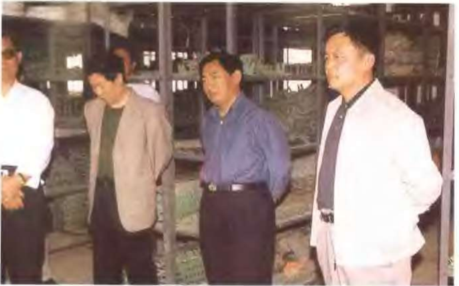
聊城市委书记郭兆信（中）在高唐镇党委书记吕端义（右一）的陪同下，在我县民营企业视察。