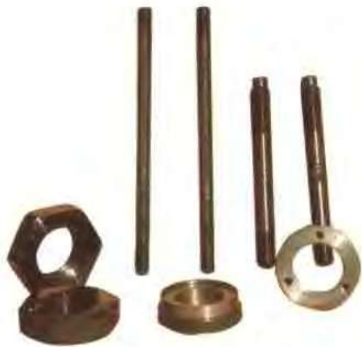
高唐县吉利机械有限责任公司生产的农机配件