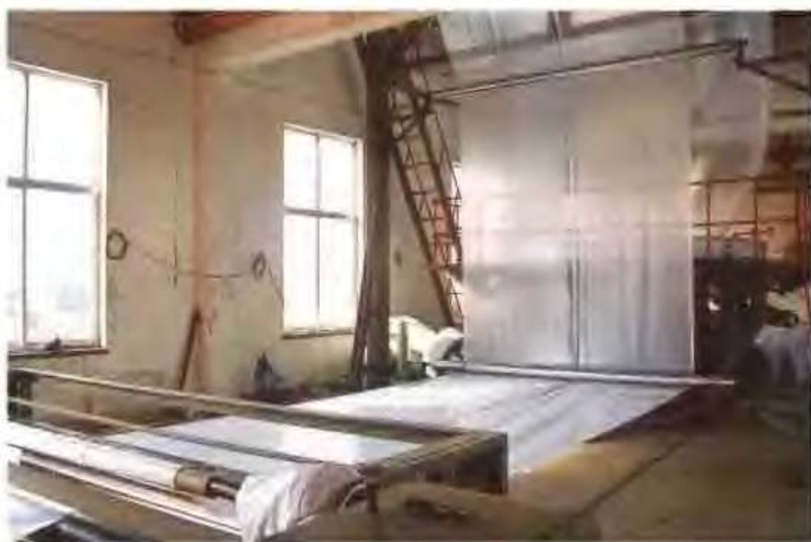
塑达塑料厂的150型吹塑机