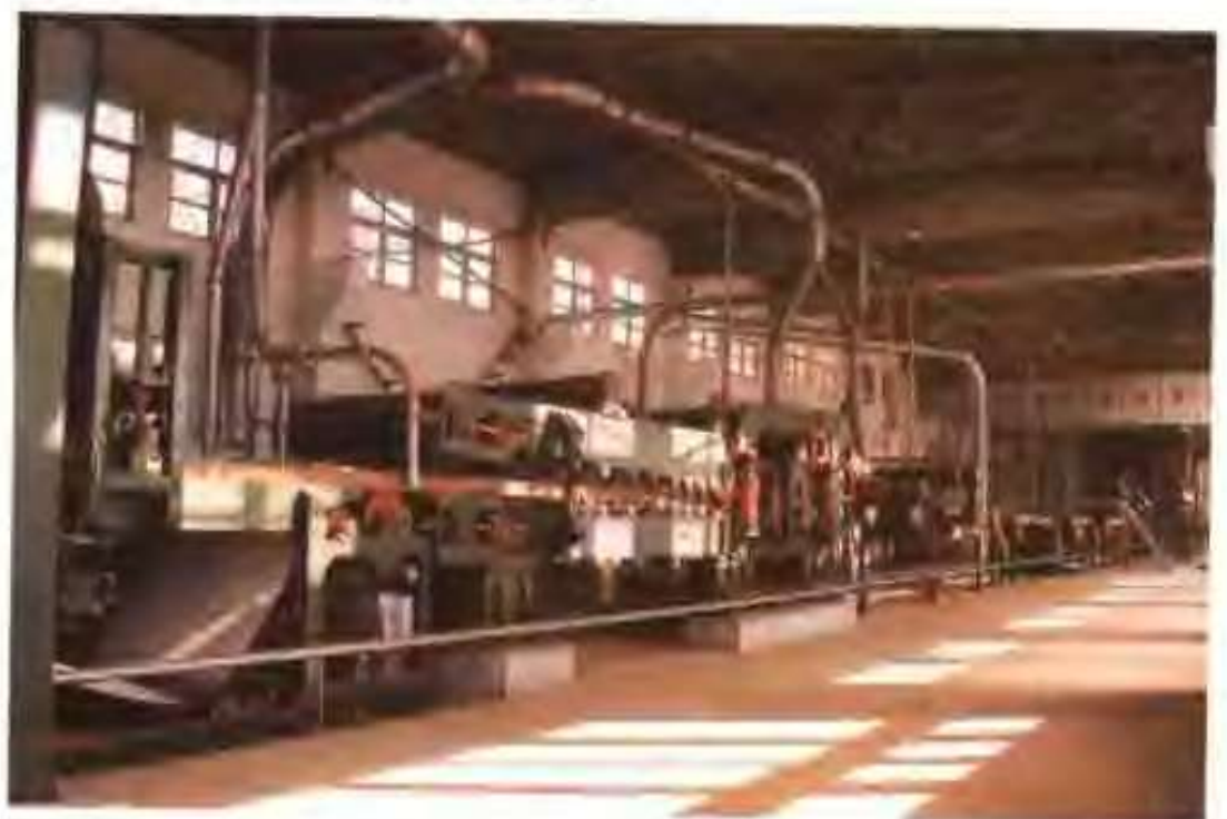
金兴人造板有限公司铺装机