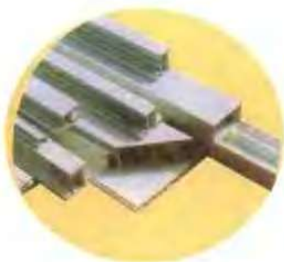
顺达橡塑制品厂生产的型材和板材