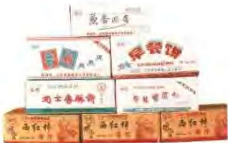
小宝贝食品厂生产的各种产品