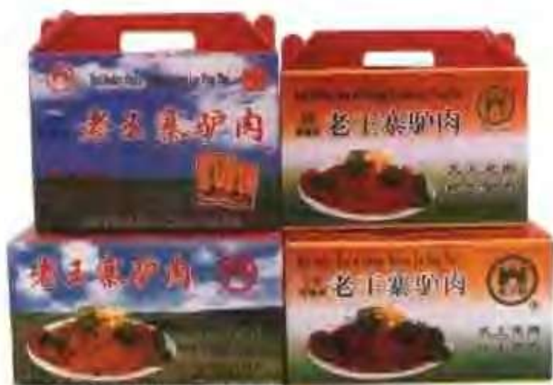
老王寨食品有限公司的驴肉礼品