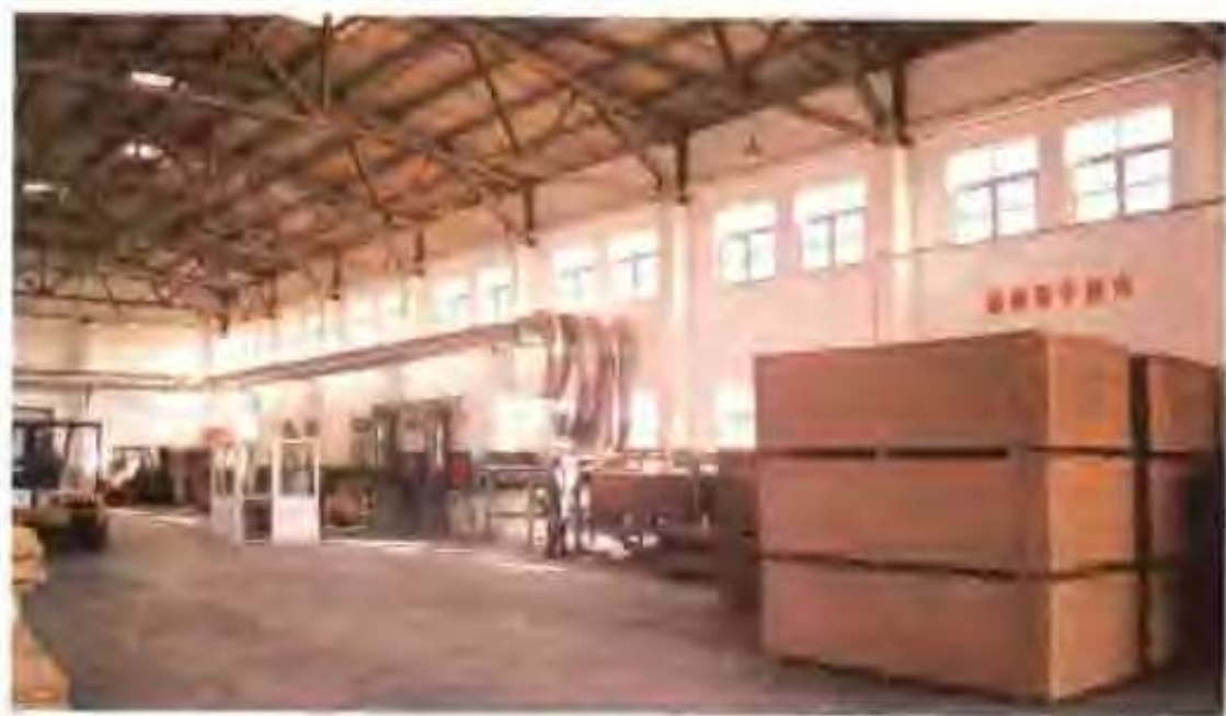
金兴人造板有限公司 沙光机车间