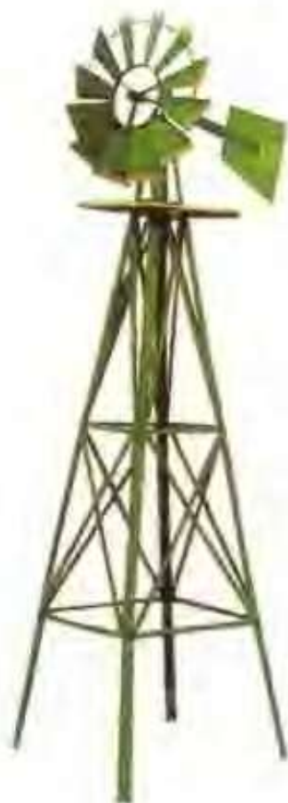
清平镇炉具厂生产的出口产品——风车