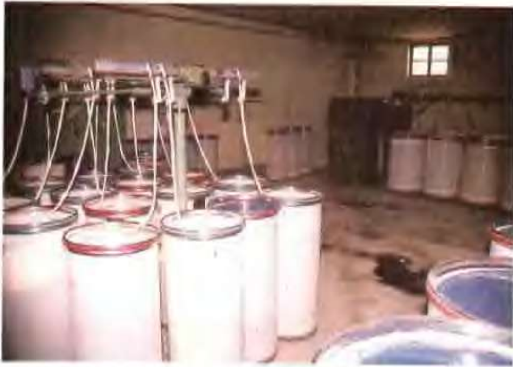
司并条车间 油棉绒加工有限公司