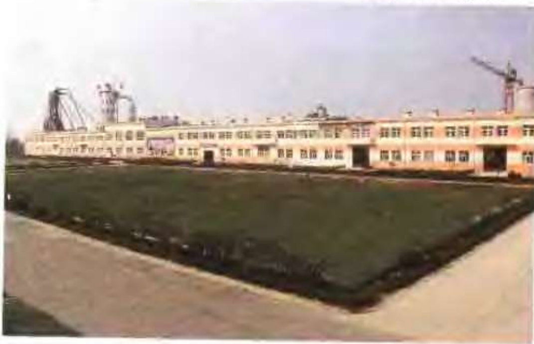
高唐县金兴人造板有限公司厂区内景