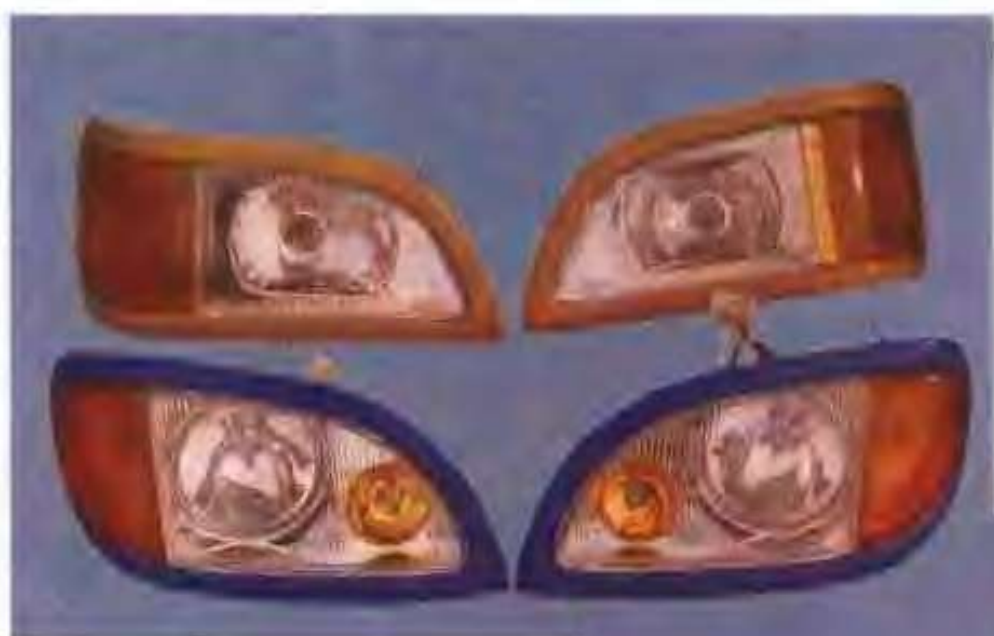
高升电器有限公司生产的各种灯具及收音机