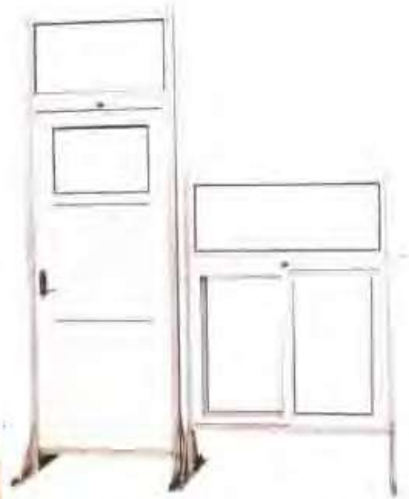
高唐县金兴塑钢门窗有限责任公司生产的塑钢门窗