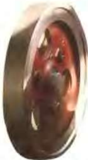
高唐县加佳动力机械制造 有限公司生产的飞轮