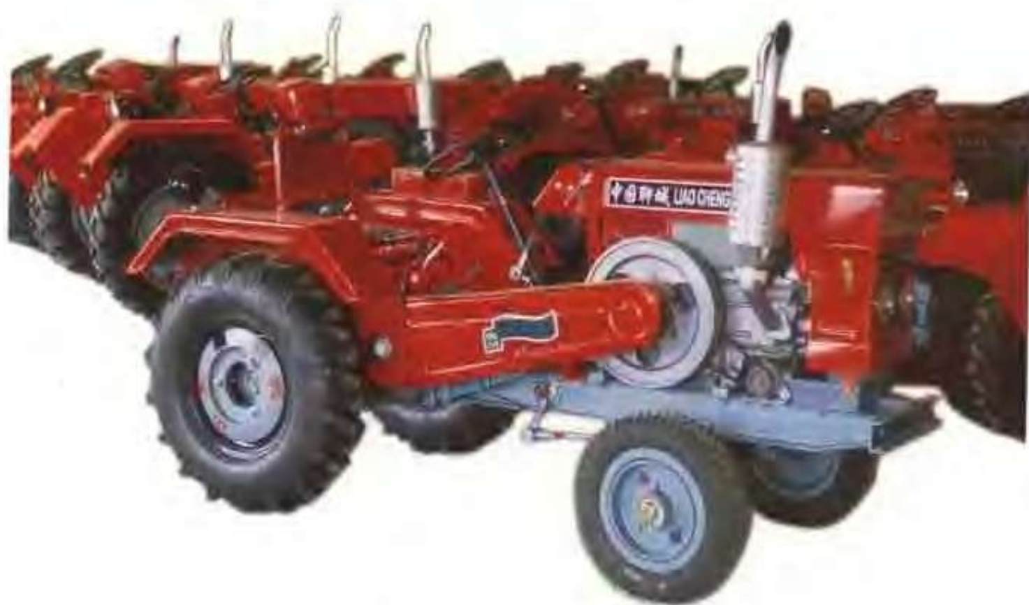
聊城鲁西拖拉机制造有限公司生产的拖拉机