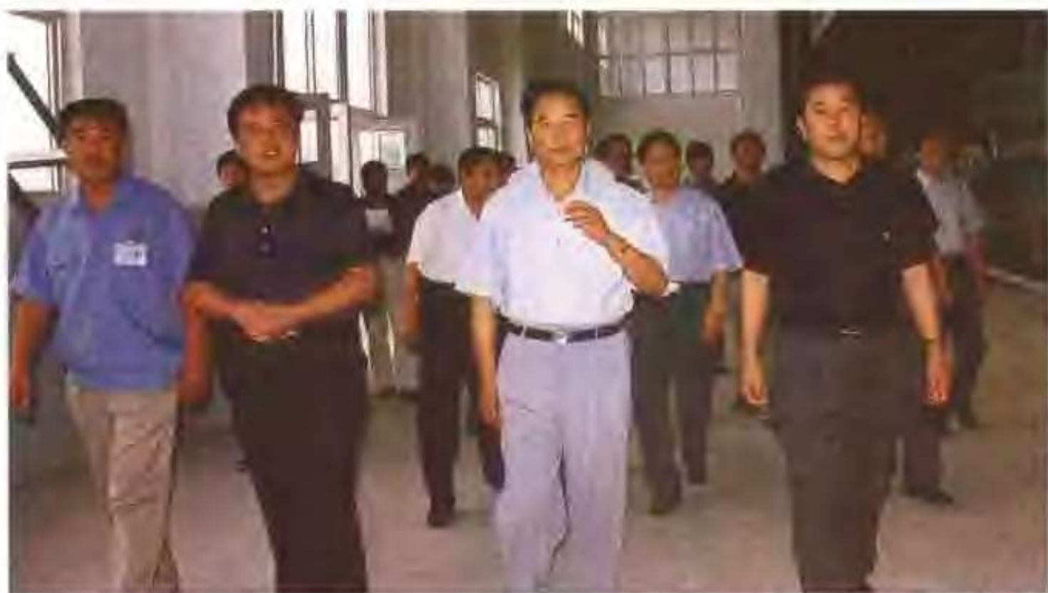
中共中央政治局委员、山东省委书记吴官正（左三）在高唐县委书记申长海（右一）、高唐镇党委书记吕端义（左二）、金兴人造板有限公司经理巩保庆（左一）的陪同下视察人造板有限公司。