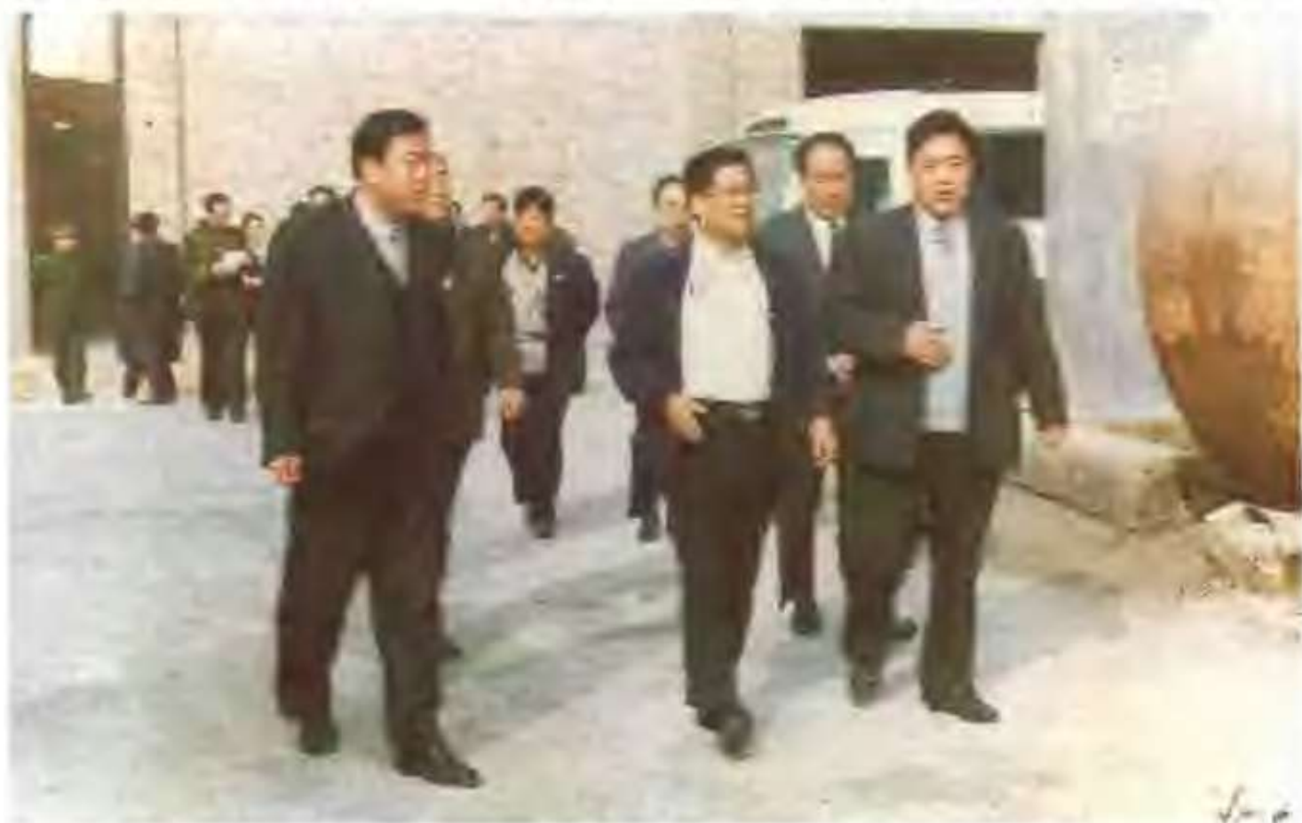
原山东省委副书记、副省长宋法棠（左二）、原聊城市委书记张敬涛（左三）在高唐县委书记申长海（右一）、吉地尔复合肥厂厂长李玉华（右一）的陪同下视察吉地尔复合肥厂。