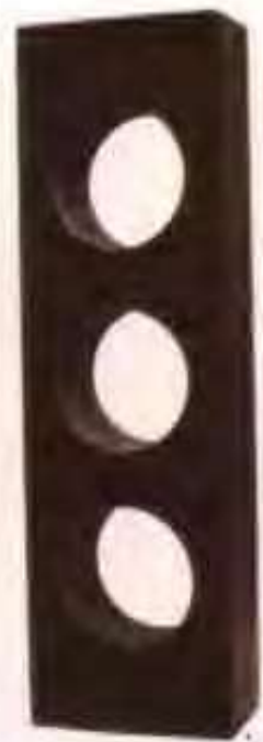
高唐县新星量仪厂生产的各种精密量具