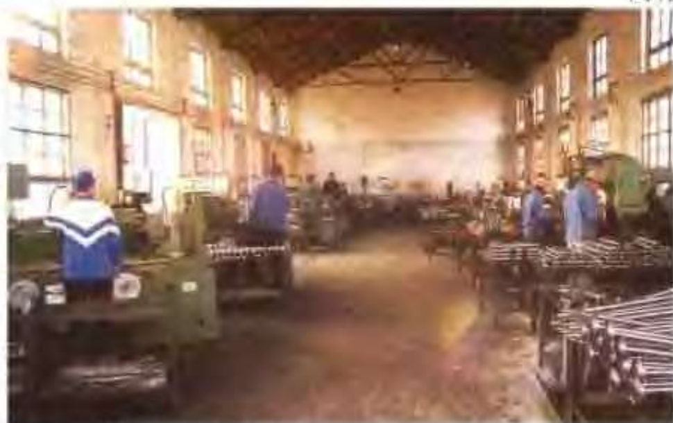
高唐县鲁西汽车配件厂机加工车间