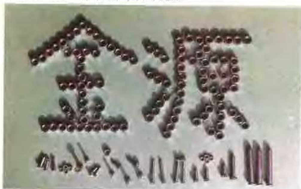
金源标准件厂生产的各种标准件