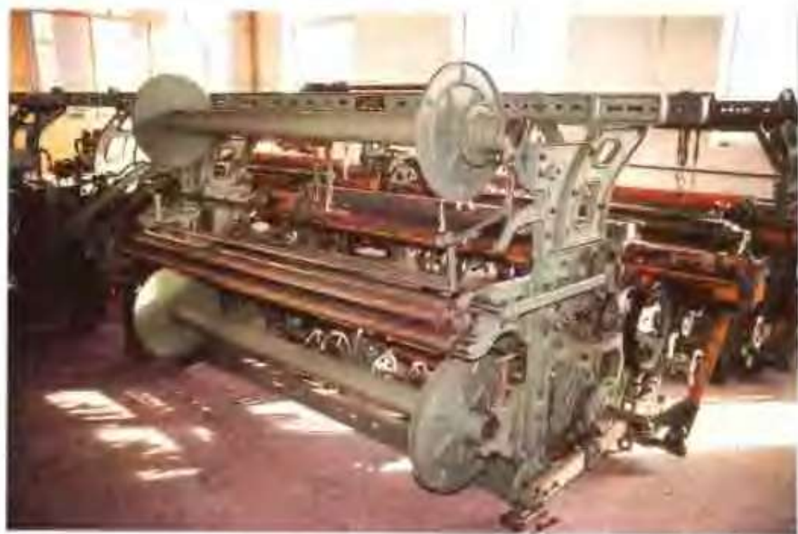
纺机制造有限公司生产的 GA615 型织布机