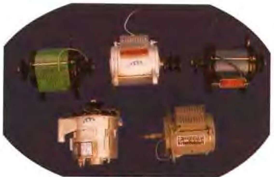
高唐县永兴轴承厂生产的各种电机