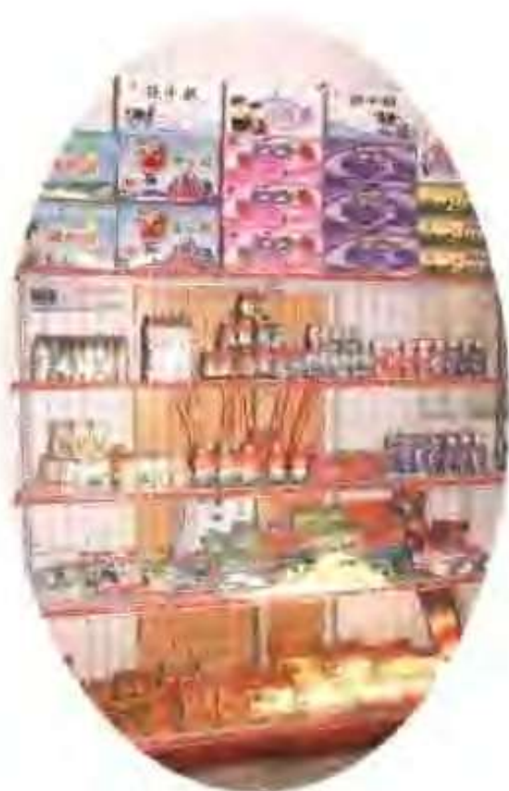
高唐县大三元食品厂生产的系列产品