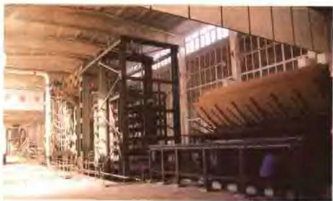
金兴人造板有限公司 的热压机