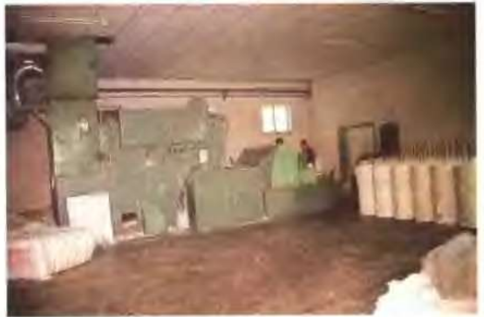
清平汽流纺纱厂 的清花机