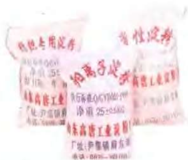
高唐县永康工业淀粉厂生产的工业淀粉