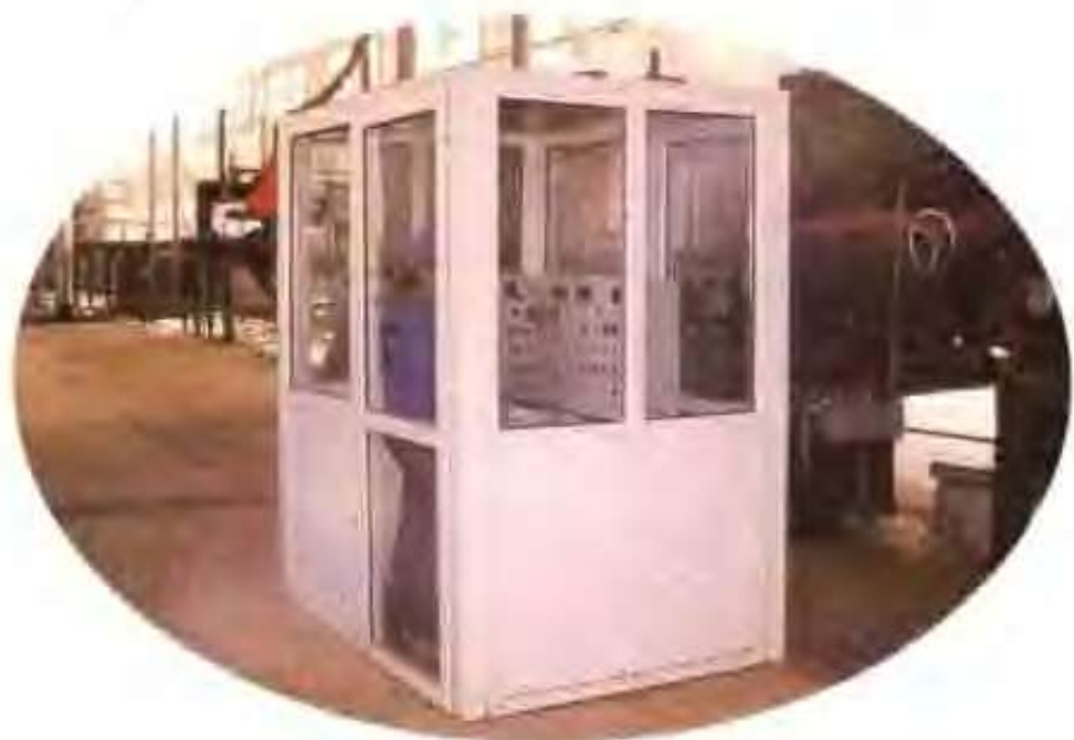
金兴人造板有限公司的 自动化电脑主控室