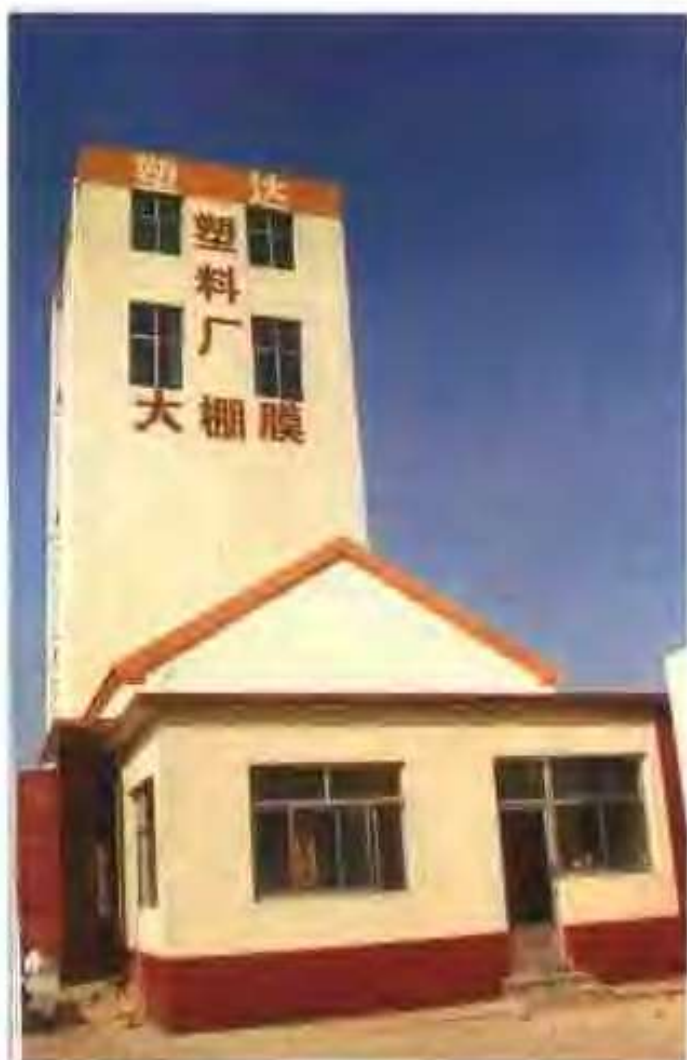
高唐县塑达塑料厂车间外貌