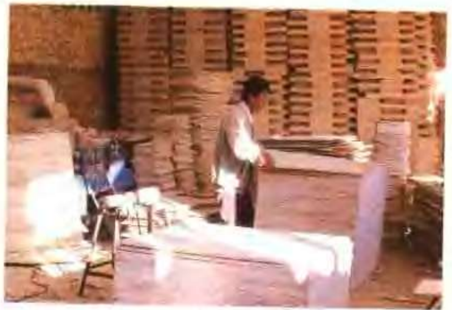
高唐县如意板材厂生产的板材