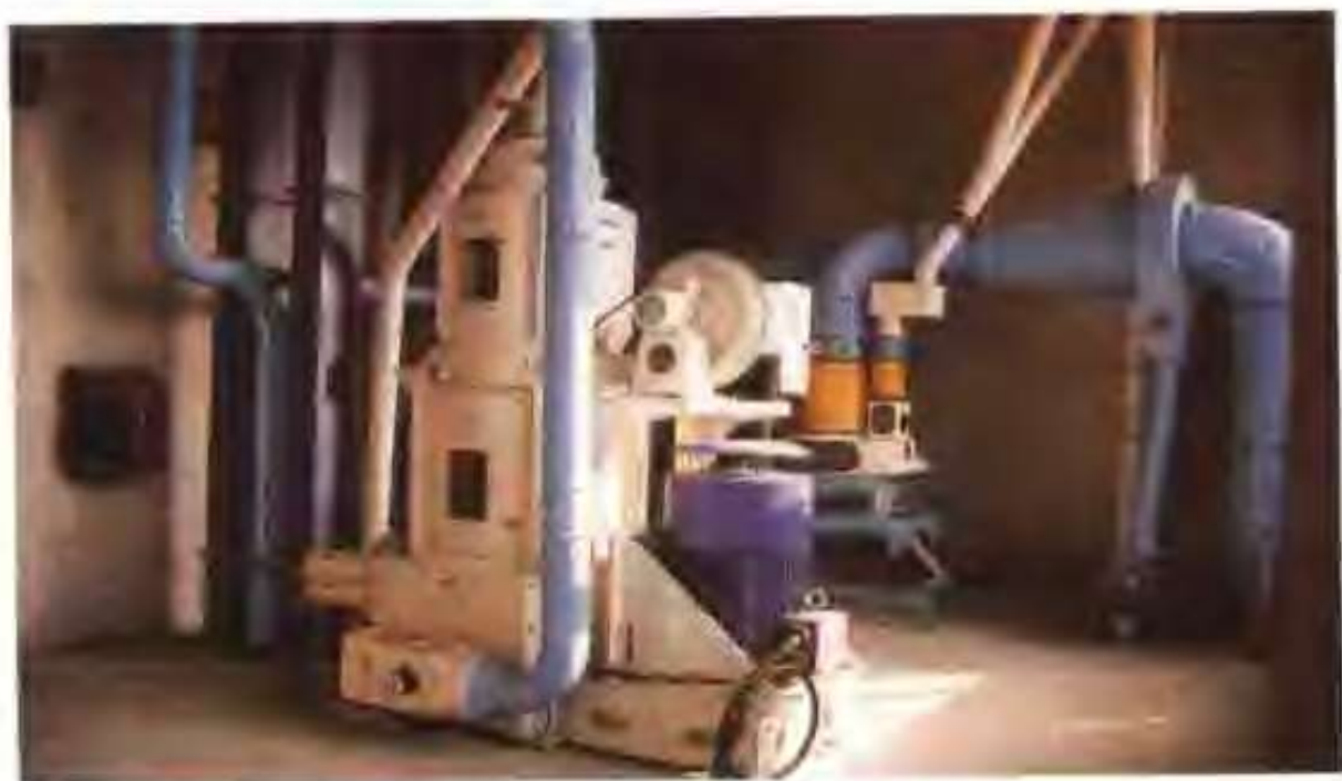
伟力面粉有限公司从日