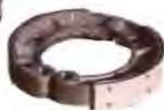
华风机械制造有限责任公司生产的制动蹄