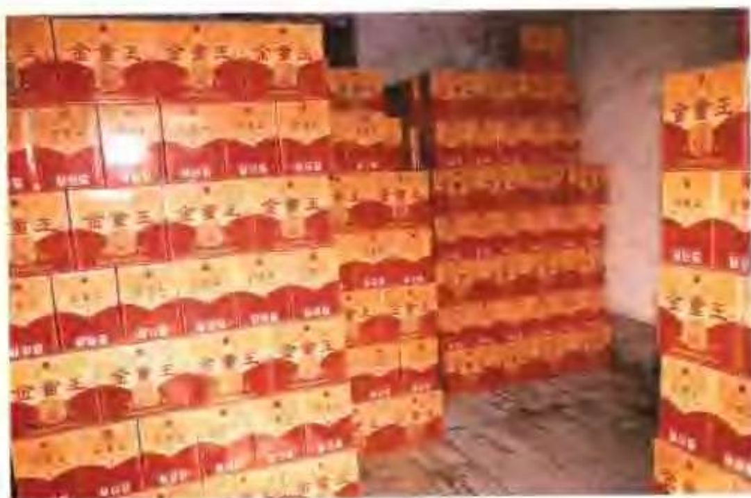
高唐县鑫东宏联有限公司生产的金童王白酒