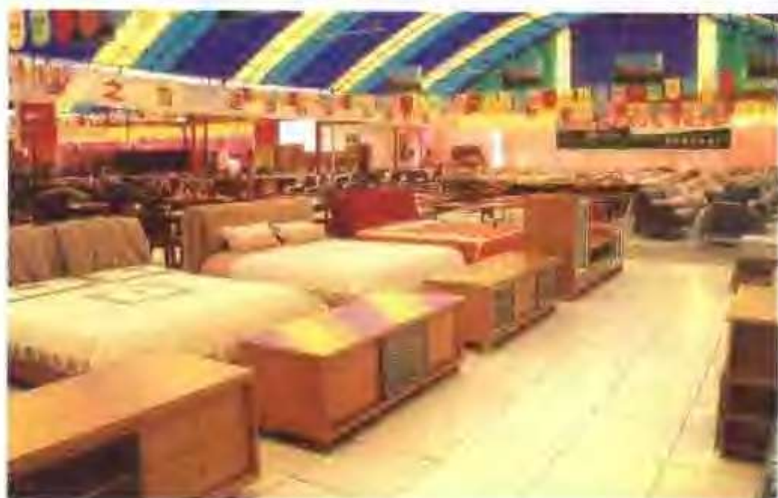
高唐东方沙发厂展厅一角