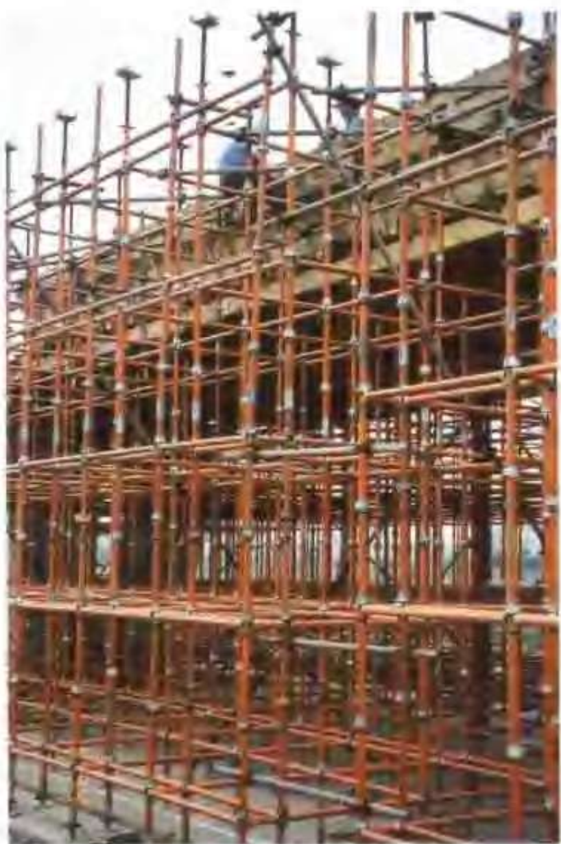
高唐县万达钢模板厂生产的脚手架