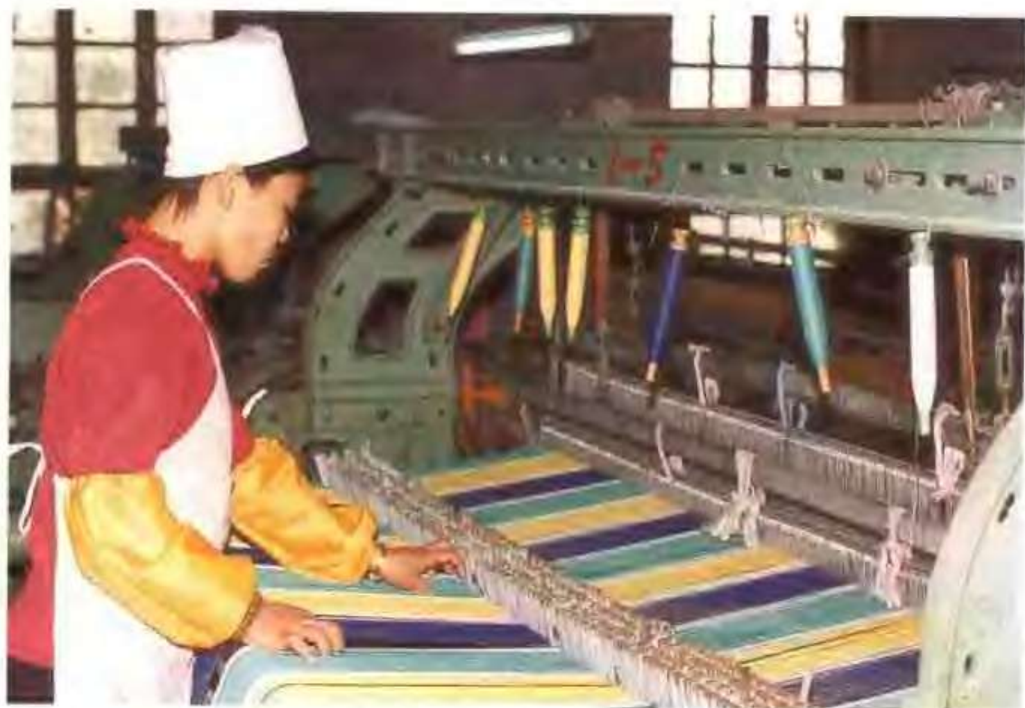
高唐县金鑫色织厂工人正在 56 型织布机前操作