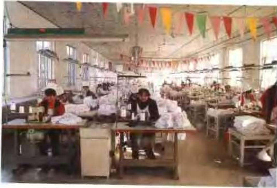
高唐县高明针织服装有限公司制衣车间