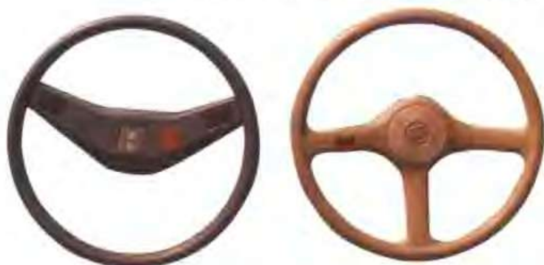
高唐县金源标准件厂生产的农用车方向盘