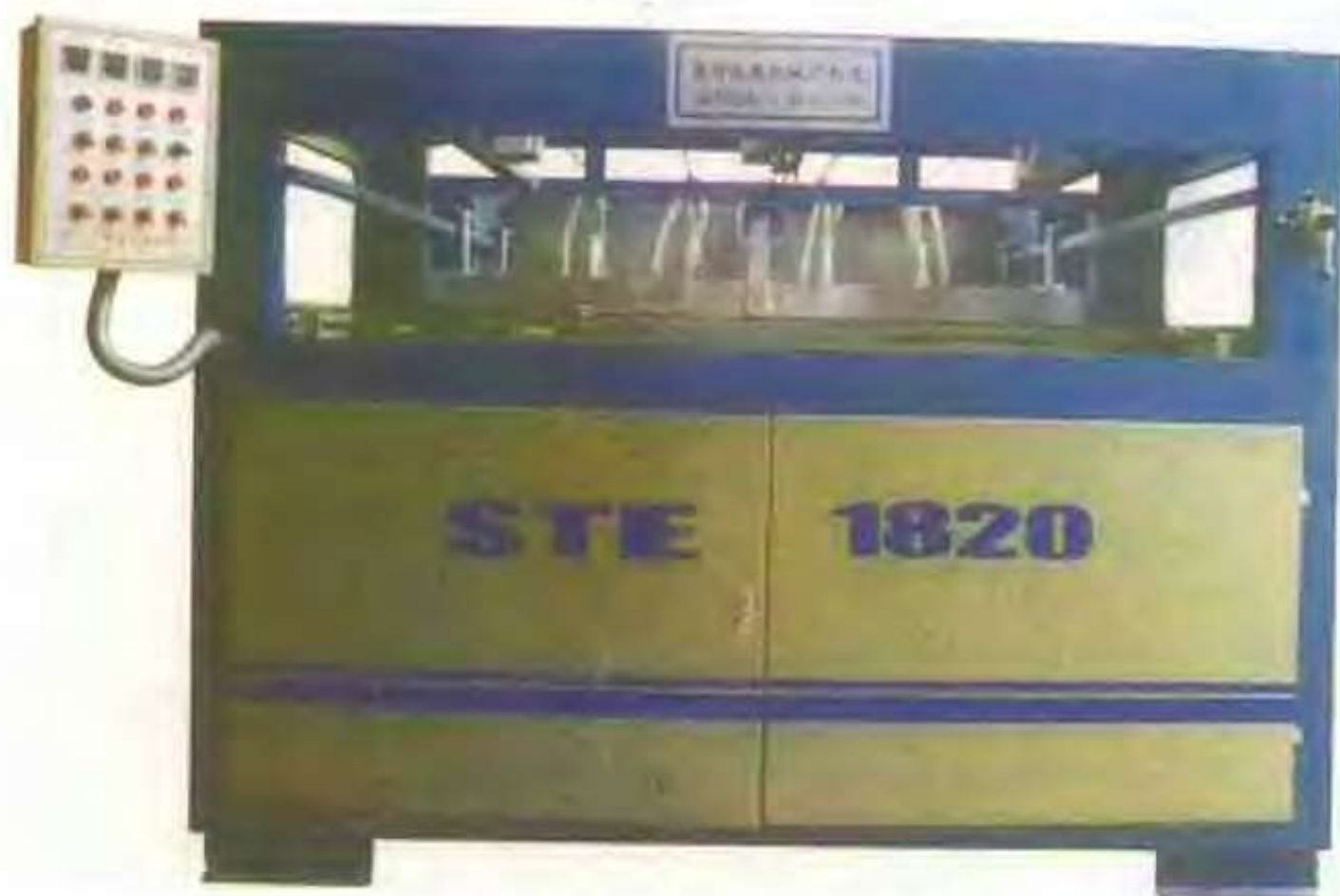
顺达橡塑制品厂的全自动吸塑机