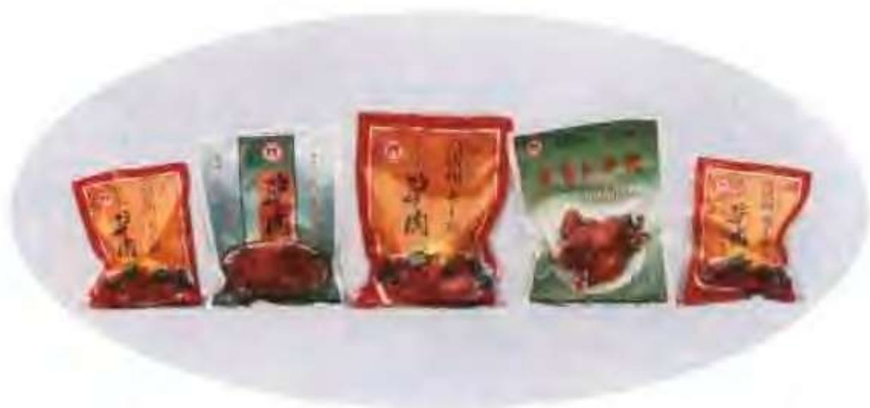
高唐县老王寨食品有限公司生产的传统名吃—驴肉