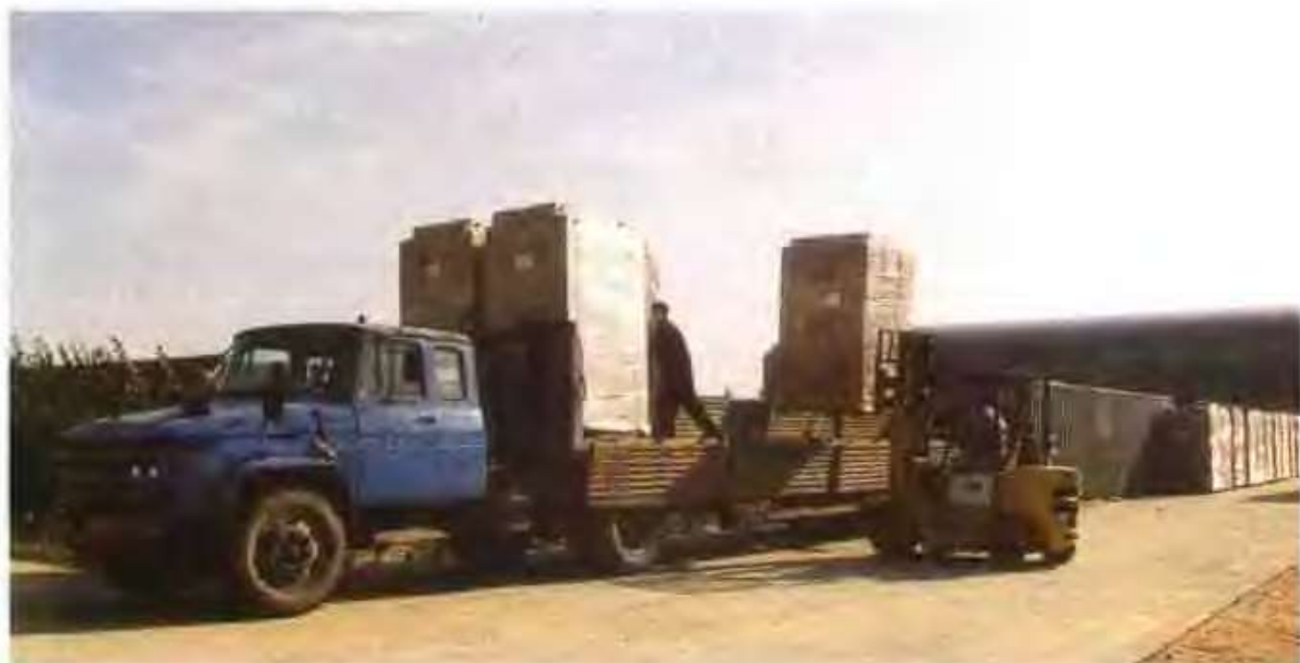
高唐县双龙公司正在装车外运的产品