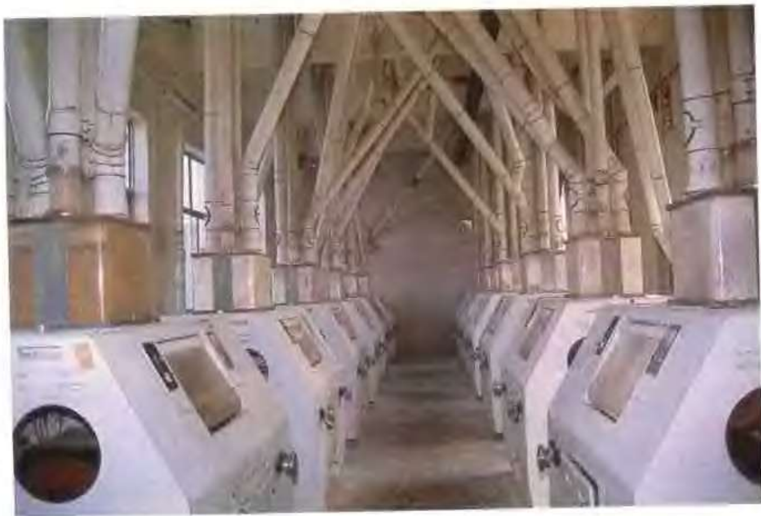
高唐县和兴面粉有限公司的磨粉机