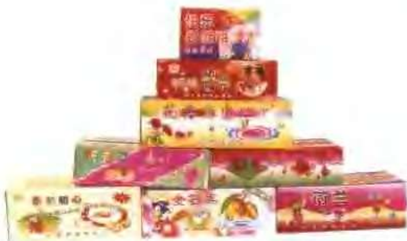
高唐县圣达食品厂生产的产品