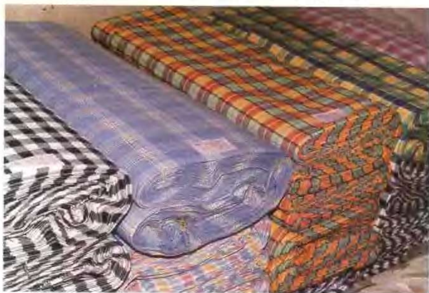
金鑫色织厂生产的成品布