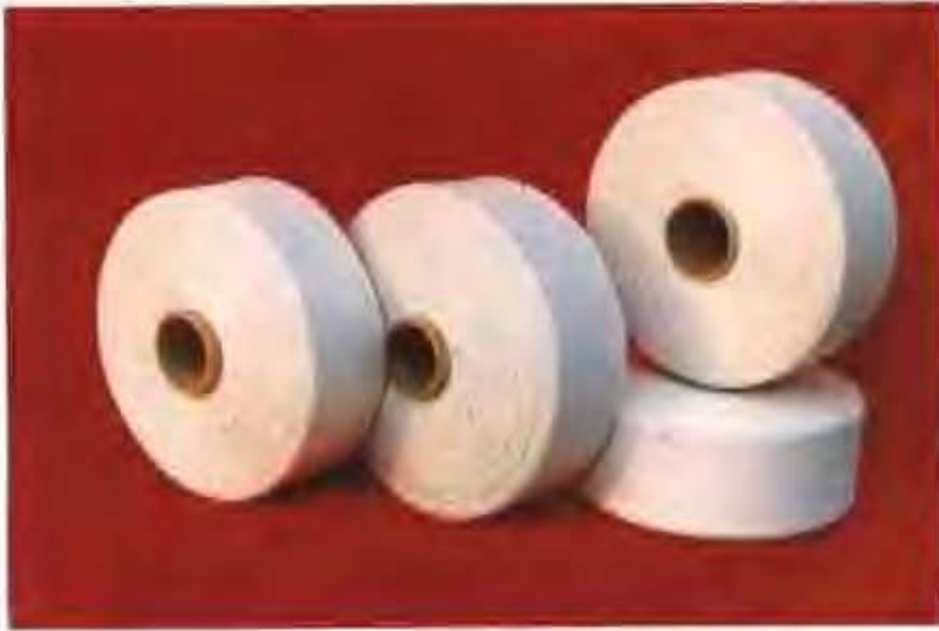
高唐县清平汽流纺纱 厂生产的负十支纱产品