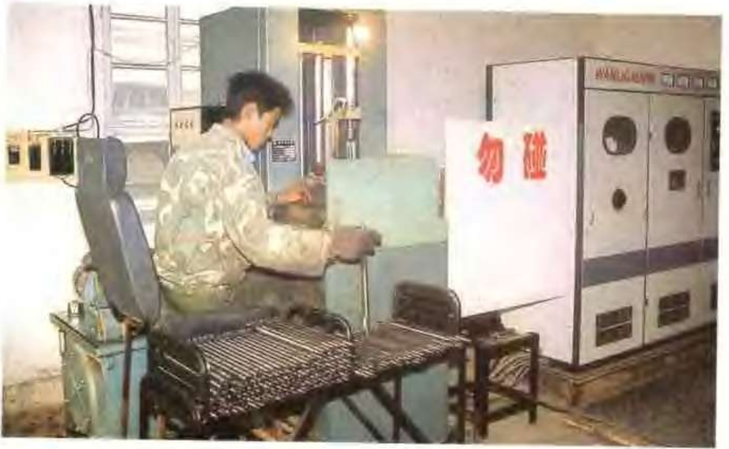
乘风工贸有限公司感应淬火设备