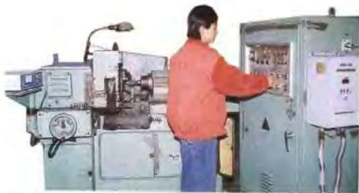
高唐县汇新汽车轴承有限公司全自动内圆磨床