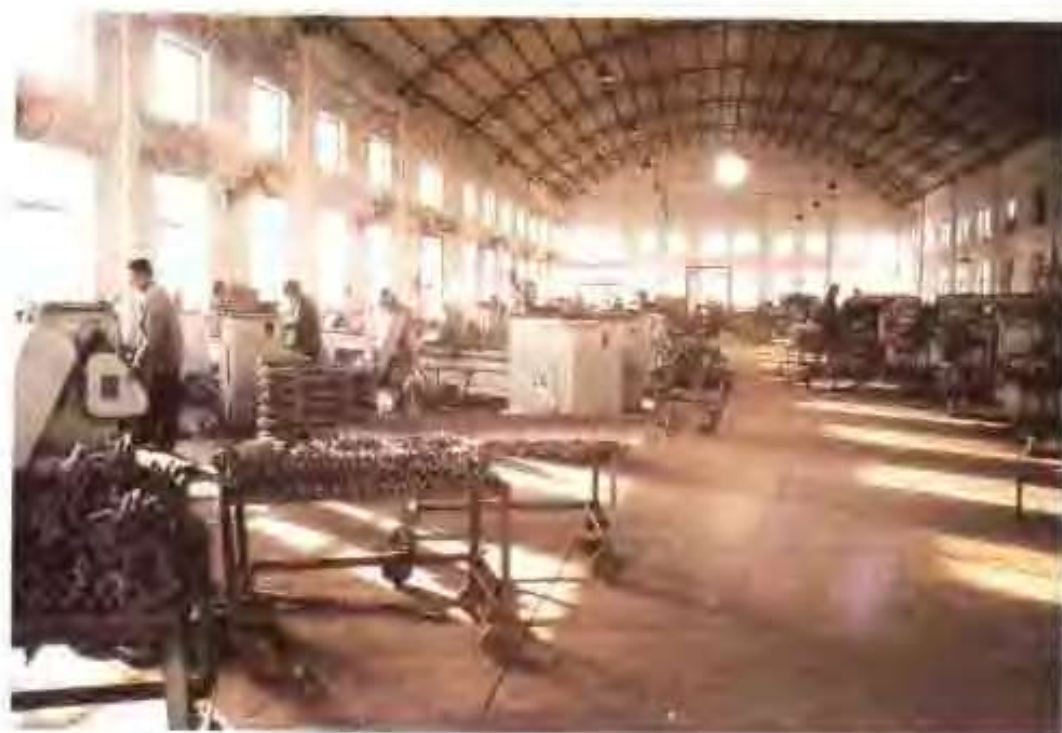
山东高唐纺机制造有限公司 公司机加工车间