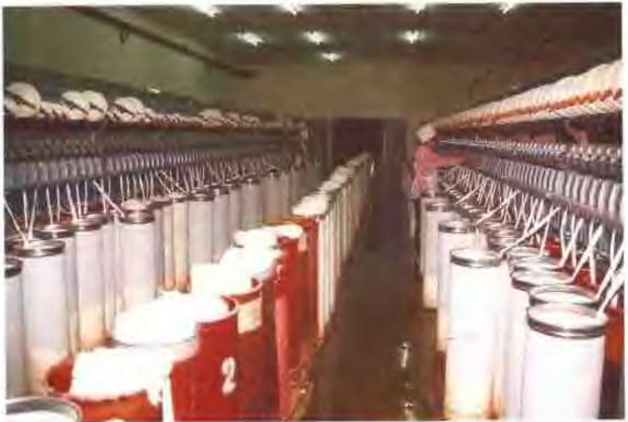
清平汽流纺纱厂并条车间