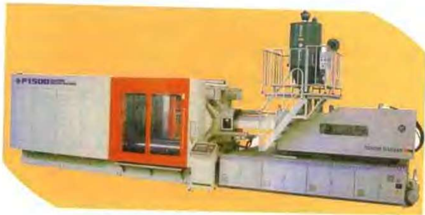
高唐县顺达橡塑制品厂的全自动注塑机