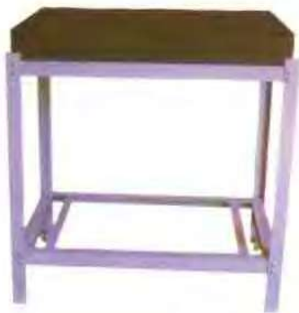
新星量仪厂生产的支架和花岗石平板