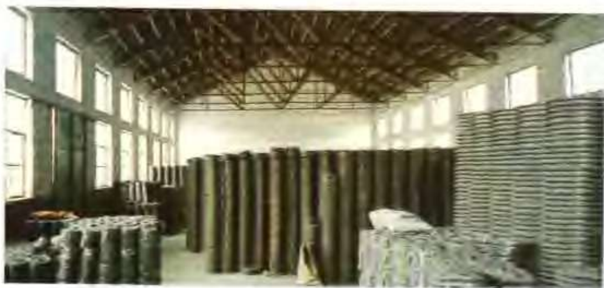
高唐县华风机械制造有限责任公司成品库