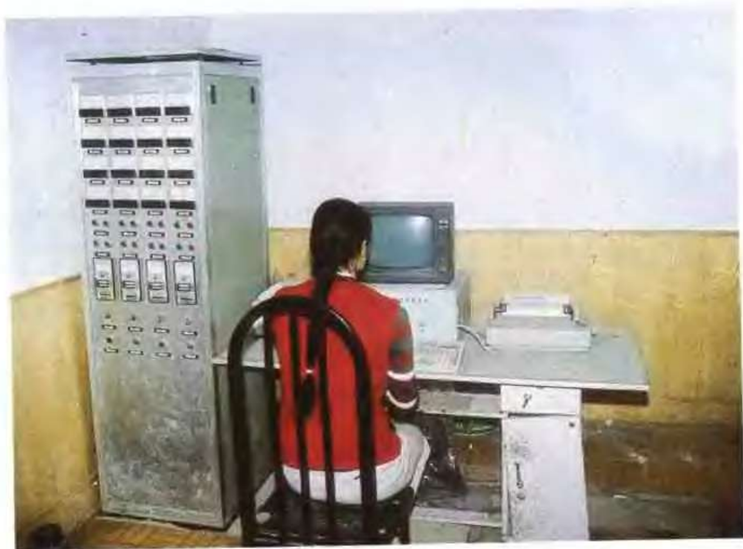
山东省吉地尔复合肥厂车间自动化主控室