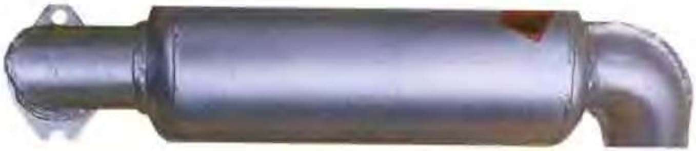
高唐县明元机械制造有限公司生产的消声器