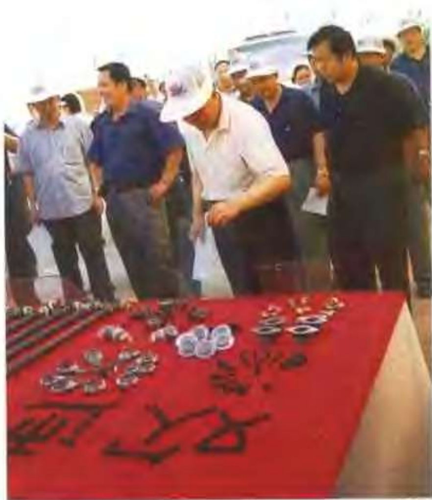
原聊城市委书记张敬涛（右二）在高唐县委书记申长海（右一）的陪同下视察中兴兴机动车配件厂。左二为该厂厂刘中兴。