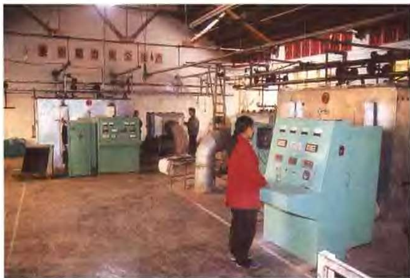
中兴机动车配件厂钢化车间