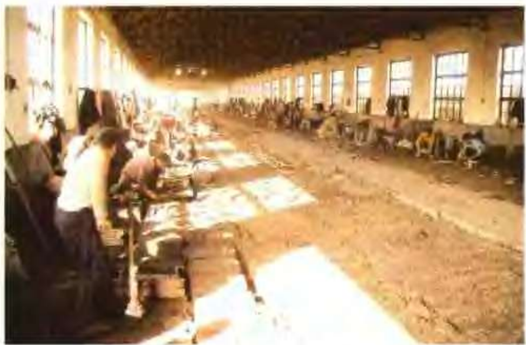
高唐县鸿运铸造厂铸造车间