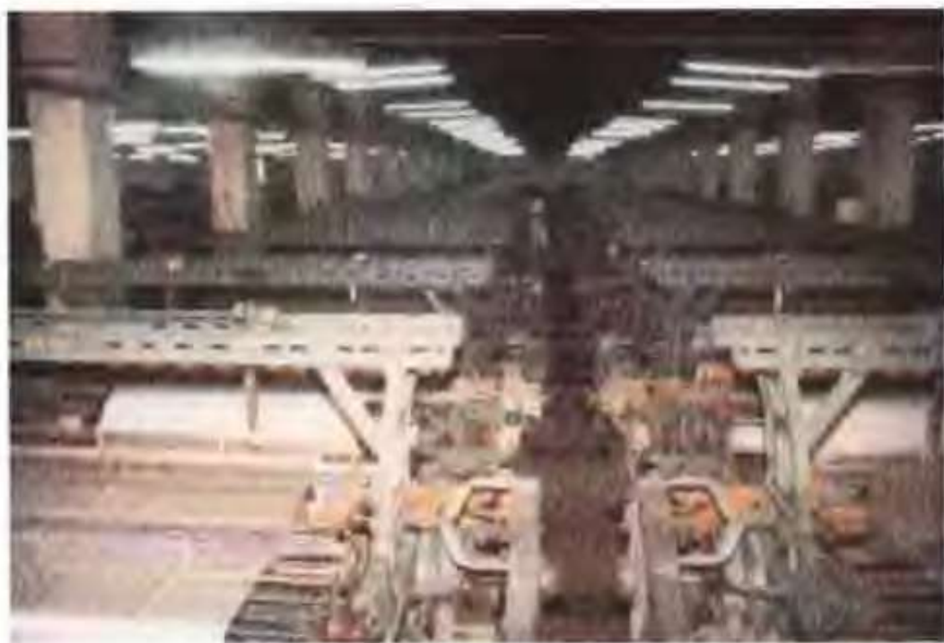
智德纺织有限责任公司 质检科工人正在检验布匹